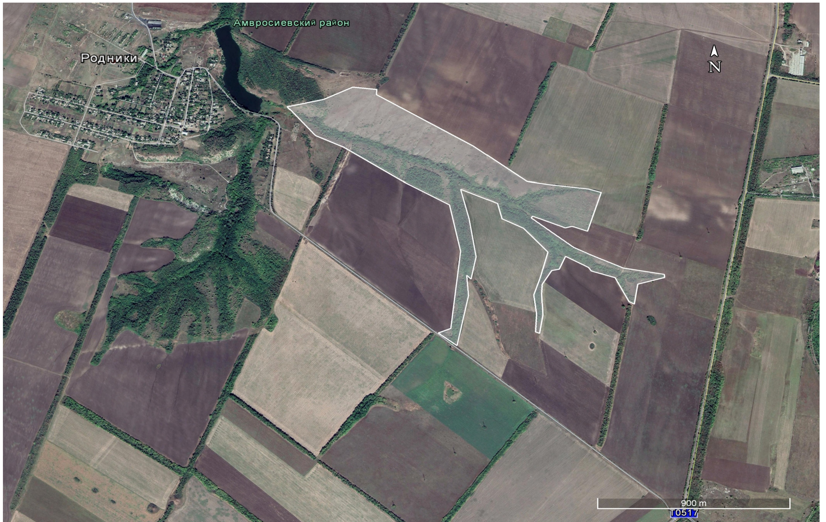
Схема особо охраняемой природной территории государственный природный заказник «Балка Казенная»