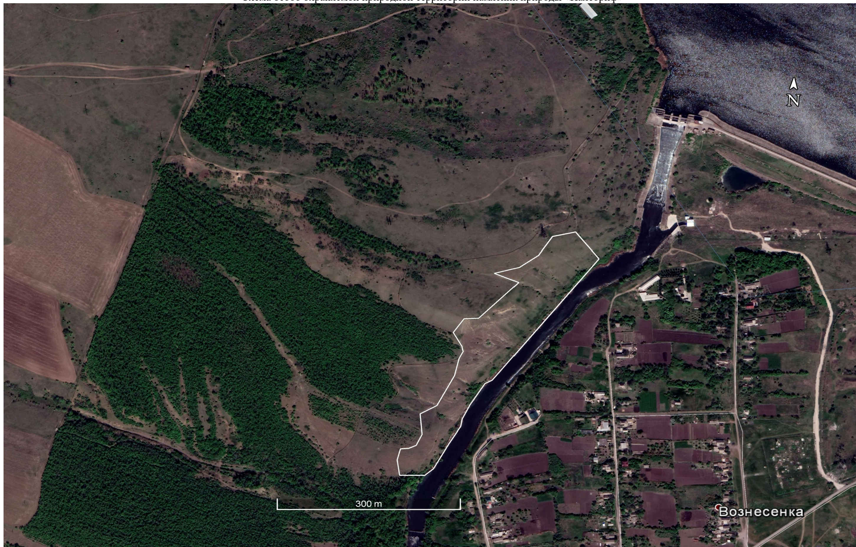
Схема особо охраняемой природной территории памятник природы «Палеорифф»