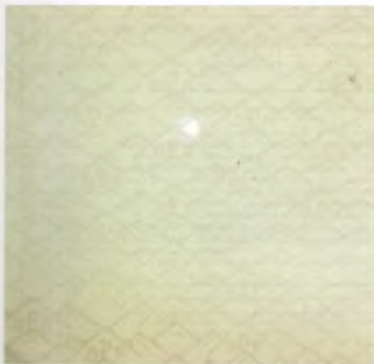
Рис. 1 Образец водяного знака на специальной бумаге.

Бумага имеет водяной знак (рисунок 1), невидимые области, выполненные антистоксовой краской, видимой в инфракрасном излучении (рисунок 2).