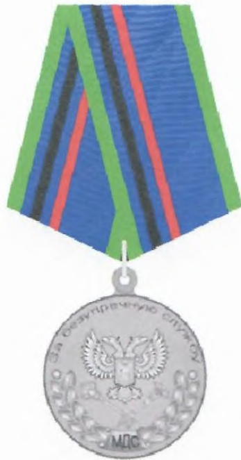
Рисунок медали Министерства доходов и сборов Донецкой Народной Республики «За безупречную службу» II степени