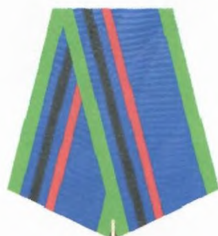
Рисунок медали Министерства доходов и сборов Донецкой Народной Республики «За безупречную службу» I степени

Приложение 2 к Положению о медали Министерства доходов и сборов Донецкой Народной Республики «За безупречную службу» (пункт 19)