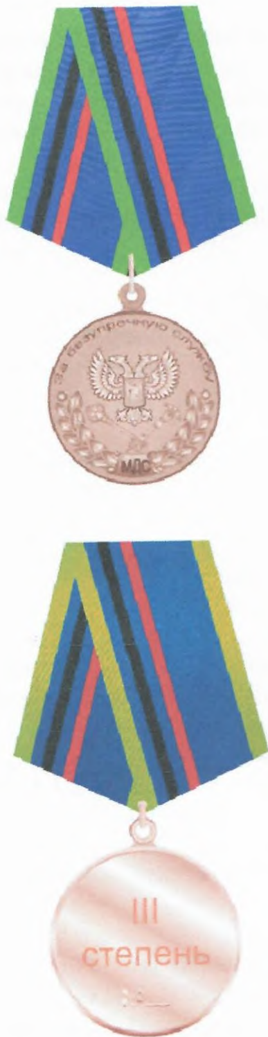
Рисунок медали Министерства доходов и сборов Донецкой Народной Республики «За безупречную службу» III степени