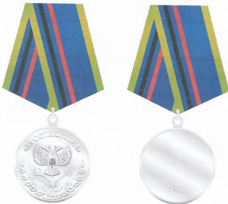
Рисунок медали Министерства доходов и сборов Донецкой Народной Республики «За содействие»

Приложение 2 к Положению о медали Министерства доходов и сборов Донецкой народной Республики «За содействие» (пункт 9)